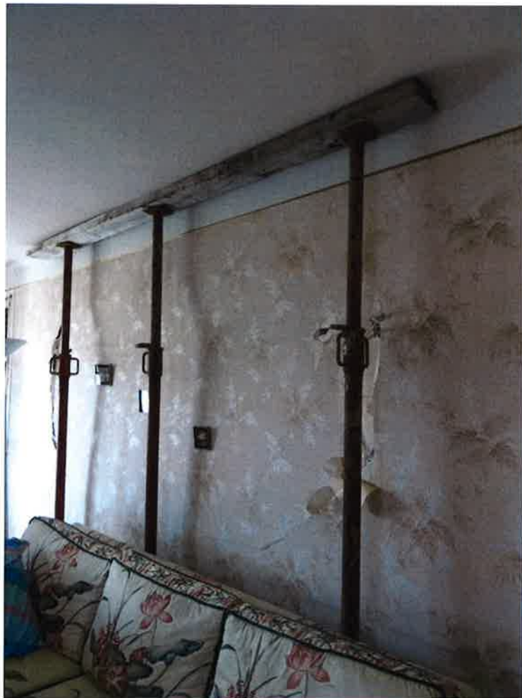
Photographie N° 18