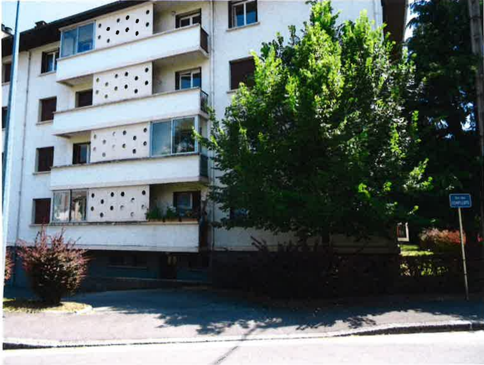
Photographie N° 15