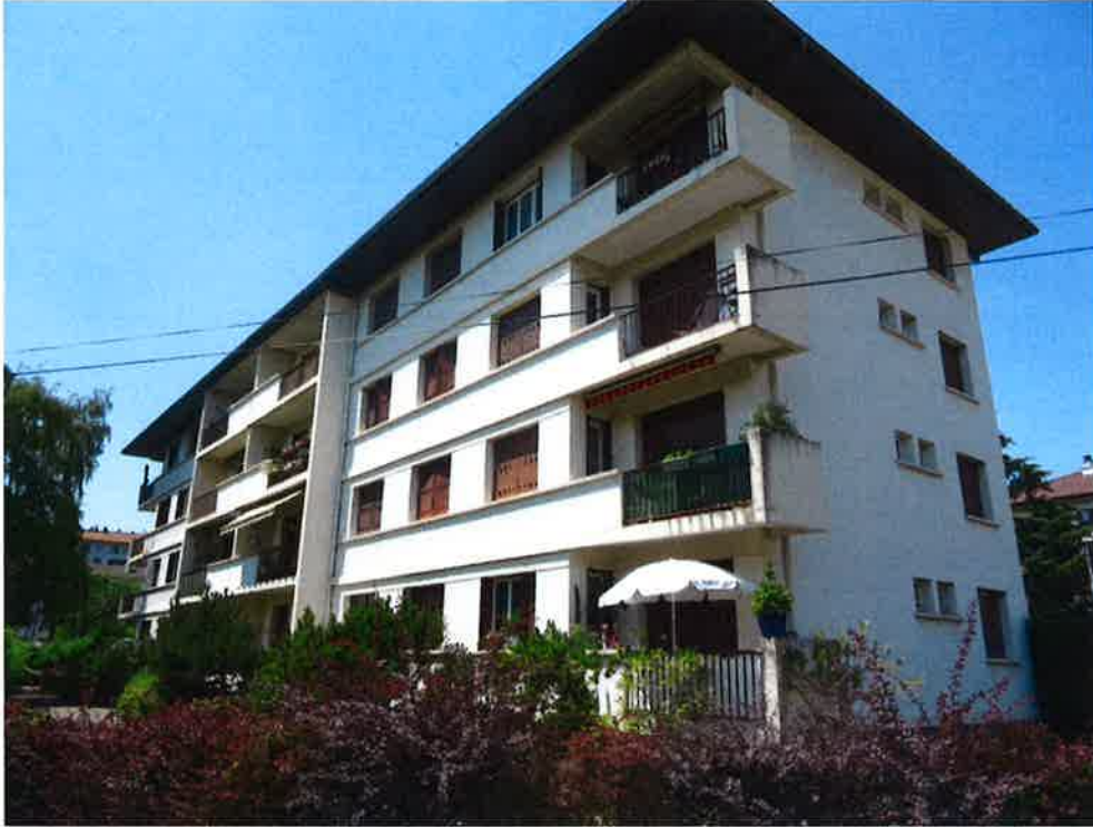
Photographie N° 7