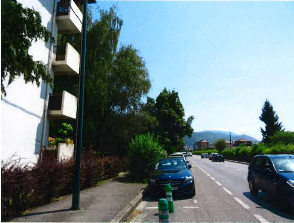
Photographie N° 3