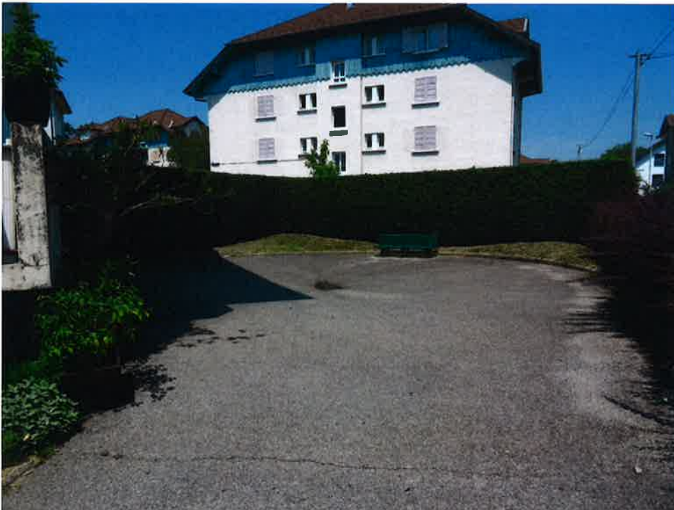
Photographie N° 4