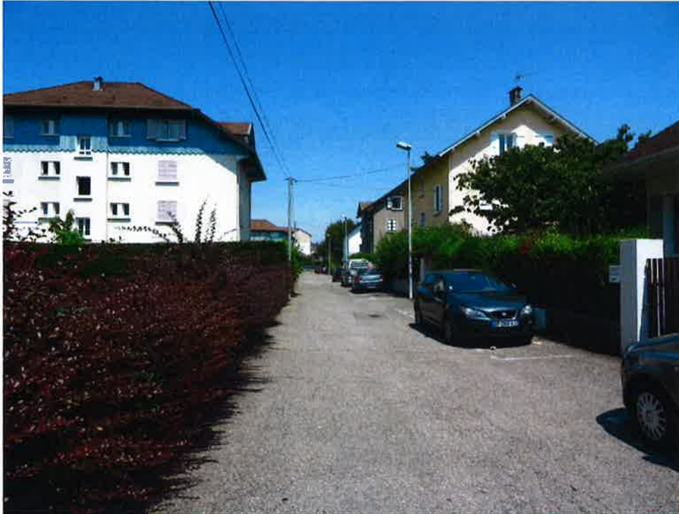
Photographie N° 1