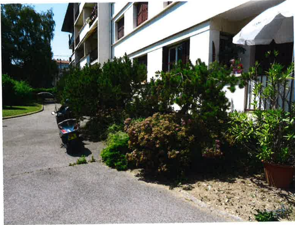
Photographie N° 5