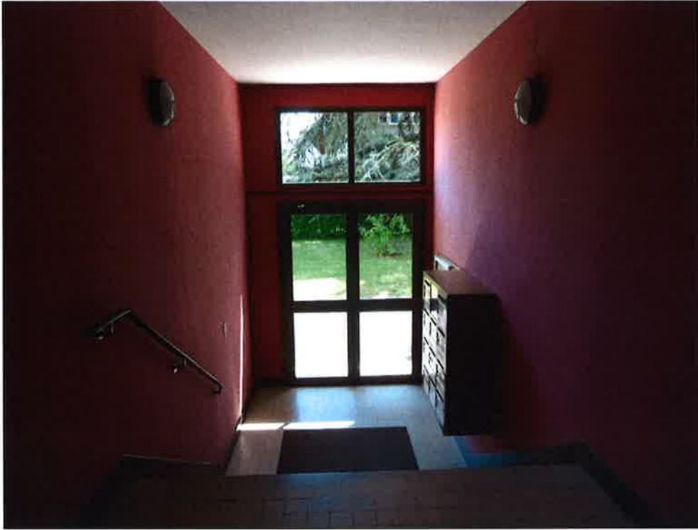
Photographie N° 11