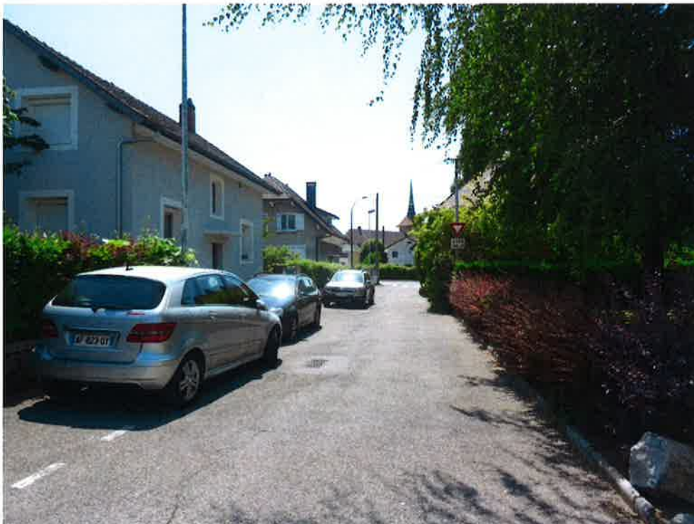
Photographie N° 2