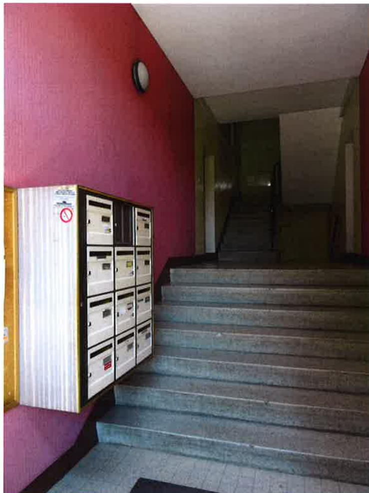
Photographie N° 10