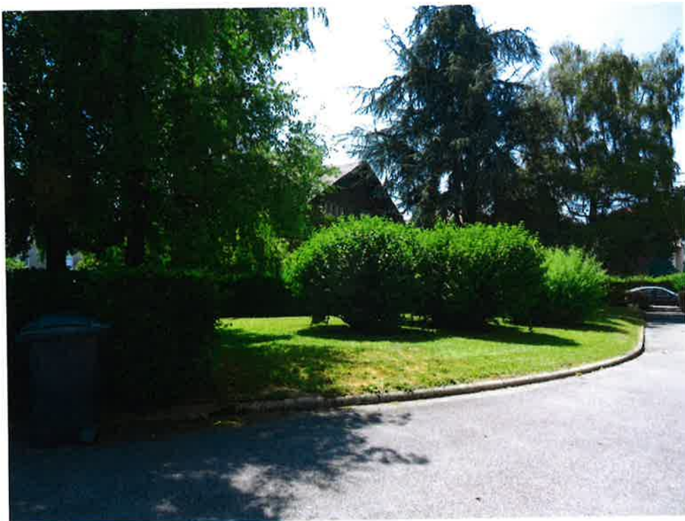
Photographie N° 6