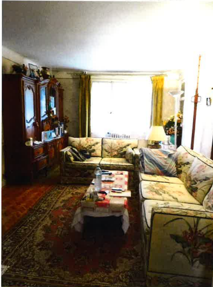
Photographie N° 17