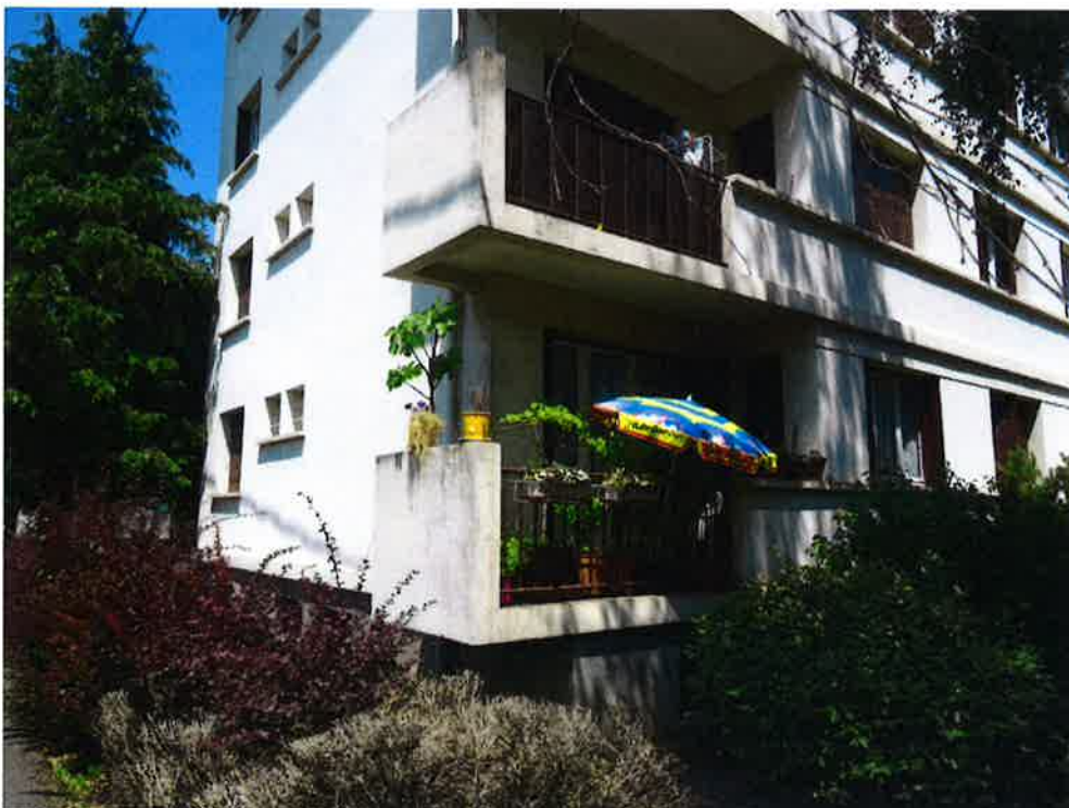
Photographie N° 14