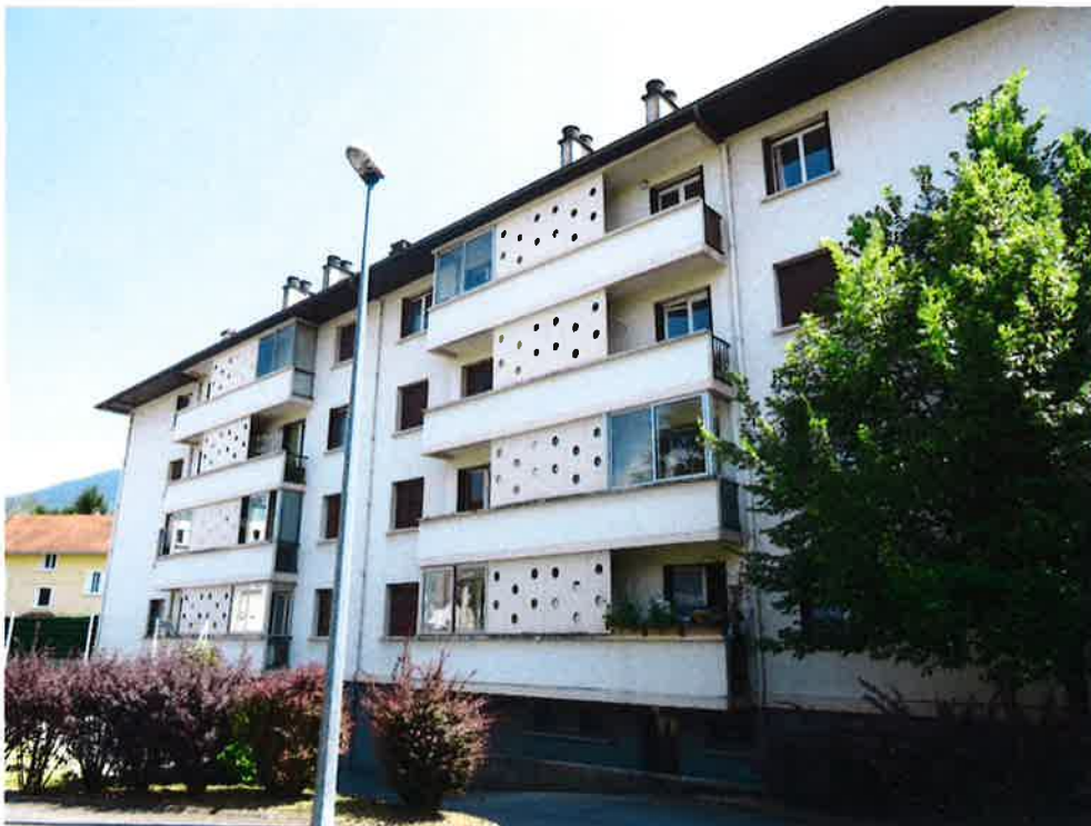
Photographie N° 8