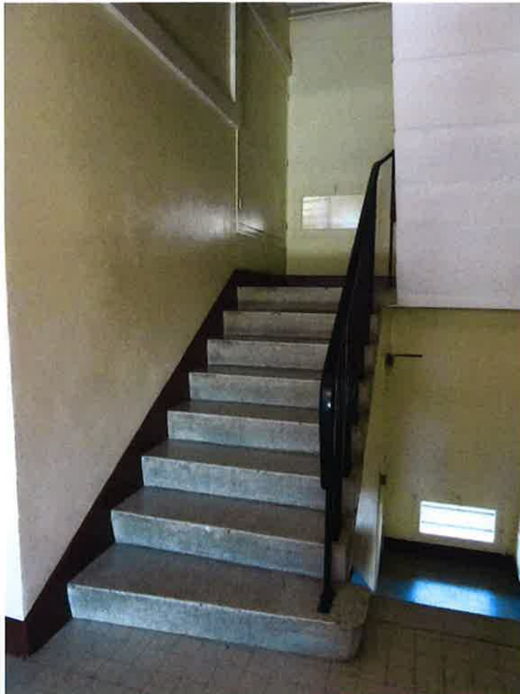
Photographie N° 12