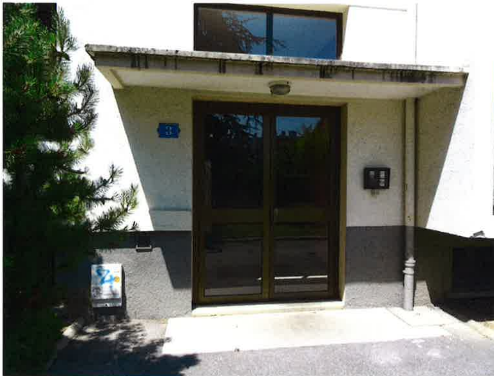
Photographie N° 9